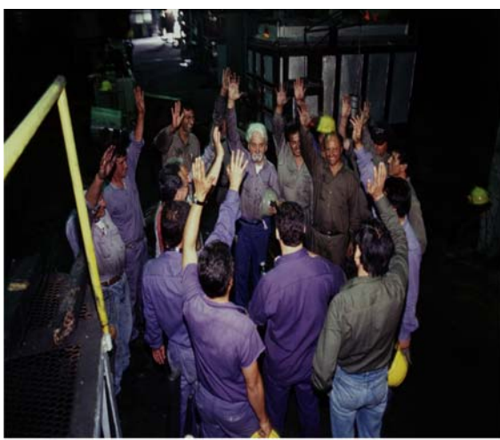
The Take Directed by Avi Lewis Produced by Silva Basmajian (NFB), Naomi Klein (Bama-Alper Productions Inc.), Avi Lewis (Bama-Alper Productions Inc.) Forja workers voting in their factory assembly (Argentina)

kurdiske byen, Sanandaj delte de ut løpesedler og ba folk om støtte. Alle arbeidernes familiemedlemmer del-